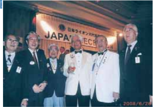
335-C地区 名誉顧問・元地区ガバナーと共に