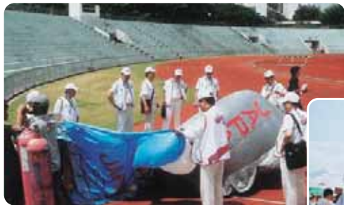
日本で製作し持ち込んだライオンアドバルーン ガスを入れて準備中