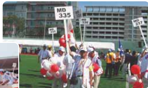
杉江大会参加メンバーがプラカードをあげ集合を呼びかける