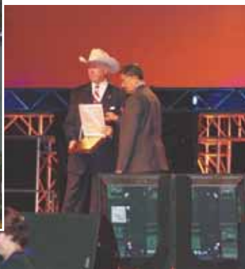
06~07 国際会長ジミー・ロスに感謝状

2008年6月25日(水) 9:00~12:30 於：インパクトコンベンションセンター(チャレンジャー)