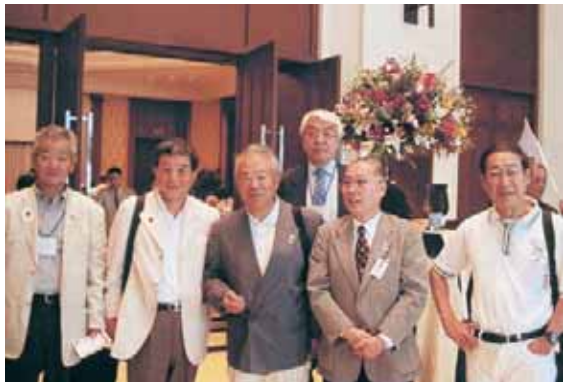
ゾーン・リジョン リーダーセミナーを終えて(ご苦労様)

2008年6月24日（火）9：00～10：30 於：ペニンシュラ・バンコク・ホテル