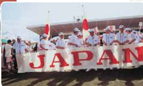
パレード出発のジャパンライオンズ