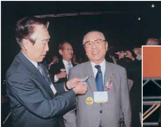
今まさにガバナー誕生

2008年6月27日（金）7：00～10：00（投票） 2008年6月27日（金）9：30～13：00（閉会式） 於：インパクトコンベンションセンター（チャレンジャー）