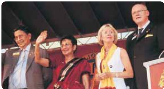
パレード審査席で手を振るマヘンドラ・アマラスリヤ国際会長夫婦