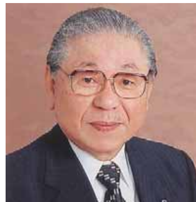
ライオンズクラブ国際協会 335-C地区ガバナー