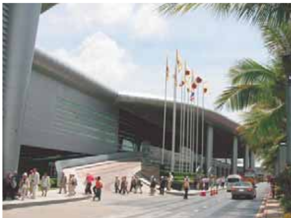
国際大会が行われた会場 「インパクトコンベンションセンター」

2008年6月25日(水) 9:00~12:30 於：インパクトコンベンションセンター(チャレンジャー)