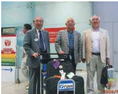
橋本ガバナー凱旋帰国